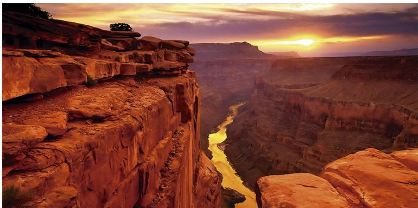
Gran Cañon

Y como cada pareja tiene un presupuesto distinto, Luvantour Viajes se adapta a las necesidades de cada una con unos precios inmejorables. Tanto si el destino son las Islas Canarias como si se trata de una estancia en La Polinesia, ellos se encargarán de que sea el mejor viaje de tu vida. Eso sí, aconsejan realizar la reserva cuanto antes para conseguir los mejores precios posibles!!!