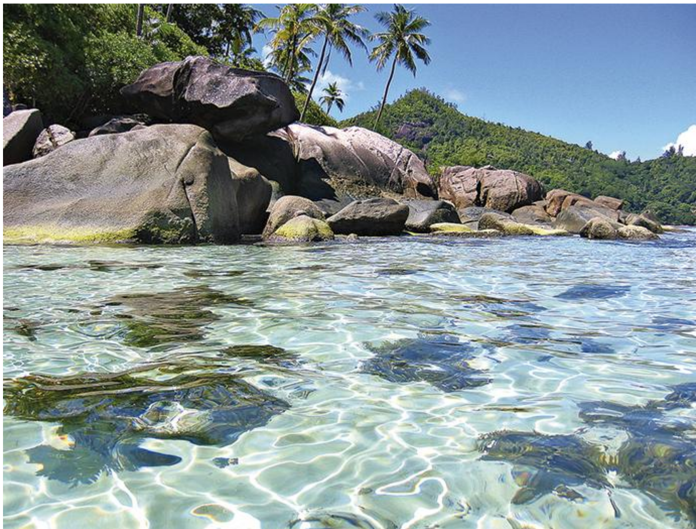
© Luvantour Viajes – Islas Seychelles

Y como cada pareja tiene un presupuesto distinto, Luvantour Viajes se adapta a las necesidades de cada una con unos precios inmejorables. Tanto si el destino son las Islas Canarias como si se trata de una estancia en La Polinesia, ellos se encargarán de que sea el mejor viaje de tu vida. Eso sí, aconsejan realizar la reserva cuanto antes para conseguir los mejores precios posibles!!!